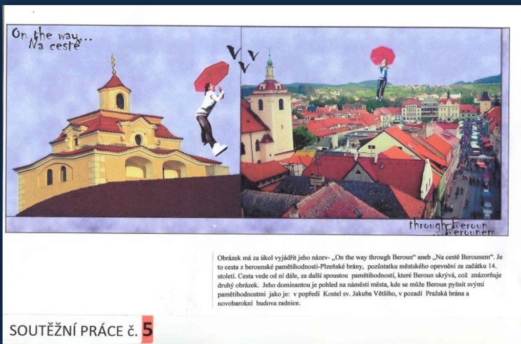
Obrázek má za úkol vyjádřit jeho název- „On the way through Beroun“ aneb „Na cestě Berounem“. Je to cesta z berounské pamětihodnosti-Ptzeňské brány, pozůstatku městského opevnění ze začátku 14. století. Cesta vede od ní dále, za další spoustou pamětihodností, které Beroun ukrývá, což znázorňuje druhý obrázek. Jeho dominantou je pohled na náměstí města, kde se může Beroun pyšnit svými pamětihodnostmi jako je: v popředí Kostel sv. Jakuba Většího, v pozadí Pražská brána a novobaroční budova radnice.