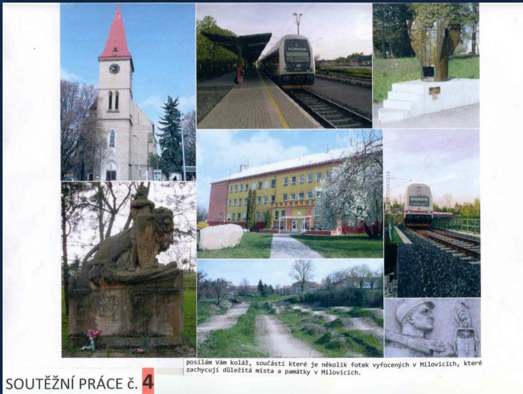
posílám Vám koláž, součástí které je několik fotek vyfocených v Milovicích, které zachycují důležitá místa a památky v Milovicích.